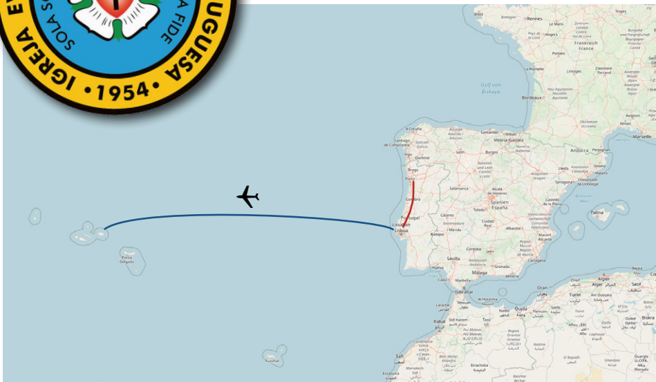
500 km liegen zwischen den beiden lutherischen Gemeinden in Mercês (bei Lissabon) und Maia (Porto) – zur dritten Gemeinde auf der Insel Terceira in den Azoren geht es nur per Flug

Weitere Informationen zur Igreja Evangélica Luterana Portuguesa: www.IELP.pt