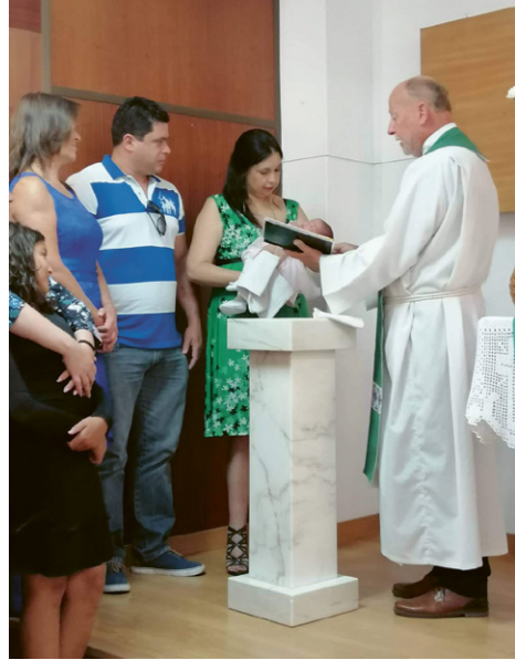
Gottesdienst und Taufe in der Gemeinde in Lissabon